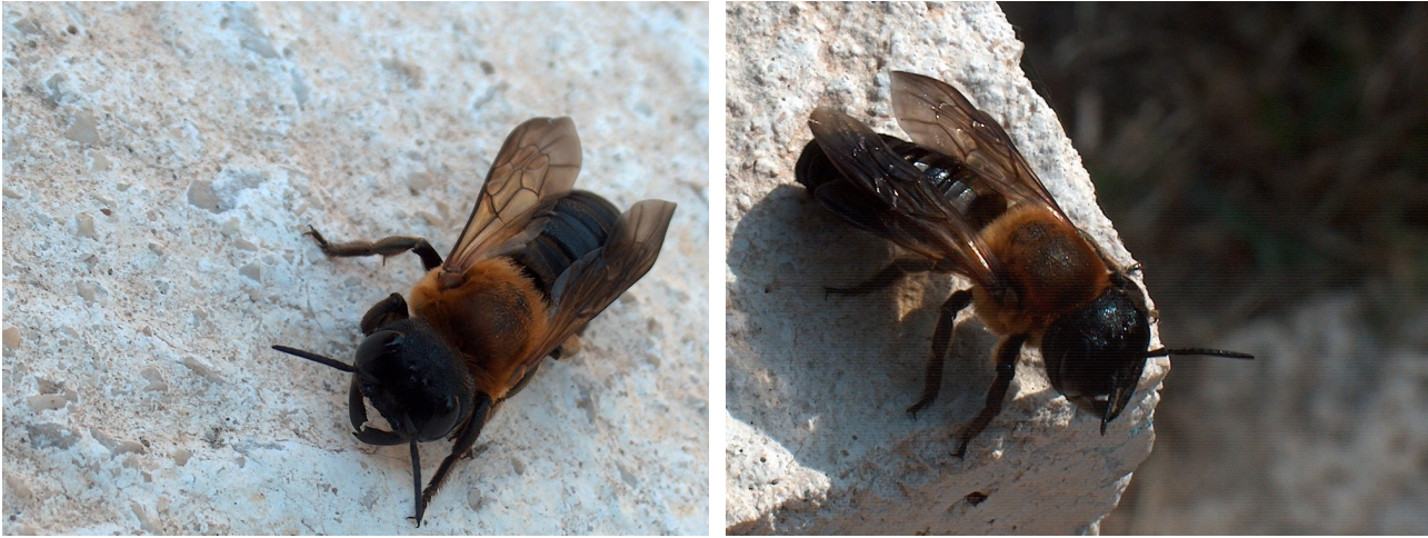
Figure 2. Femelle de Megachile sculpturalis (Hymenoptera, Megachilidae), 2.VII.2008, Allauch (France)

femelles de M. pluto nidifient dans les termitières et utilisent leurs extraordinaires mandibules pour récolter de la résine et des fibres végétales qui serviront de base à l'élaboration des cellules larvaires (Messer 1984). La biologie et la taille de M. sculpturalis lui ont valu le surnom de «giant resin bee» aux Etats-Unis où un programme de suivi de son expansion géographique est en place depuis la fin des années 1990. L'espèce semble être largement polylectique (Mangum & Sumner 2003).