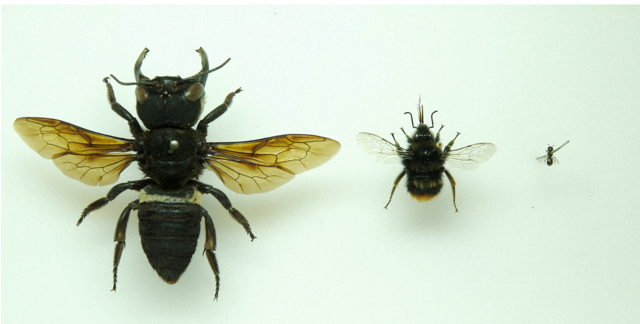
Figure 3. Megachile (Callomegachile) pluto SMITH (Hymenoptera, Megachilidae) (gauche), mâle de Bombus ruderarius (MÜLLER) (Hymenoptera, Apidae) (centre) et femelle de Ceratina parvula SMITH (Hymenoptera, Apidae). Le spécimen de M. pluto photographié est le type récolté par Alfred Russel WALLACE en Indonésie et conservé dans la collection entomologique du Musée de l'Université d'Oxford (Angleterre).