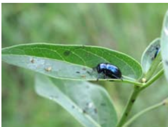
Coléoptère - Eumolpus asclepiadeus

Ce caractère filtrant du terrain, conjugué à la faible pluviosité (500 à 550 mm par an) et à l'enfoncement de la nappe phréatique, limitent le développement des arbres: il en résulte une forêt clairsemée, constituée d'un taillis sous-futaie de faible productivité, émaillée de clairières naturelles offrant un intérêt botanique exceptionnel: certaines associations végétales step-piques sont analogues à celles que l'on peut rencontrer en Europe orientale et notamment dans le bassin du Danube. L'Adonis vernalis, par exemple, y compte l'une de ses seules stations françaises. Les lisières herbacées des pelouses sèches abritent des ourlets à Géranium sanguin, dont le caractère continental est illustré par la présence de la Fraxinelle, autre plante peu fréquente en France.