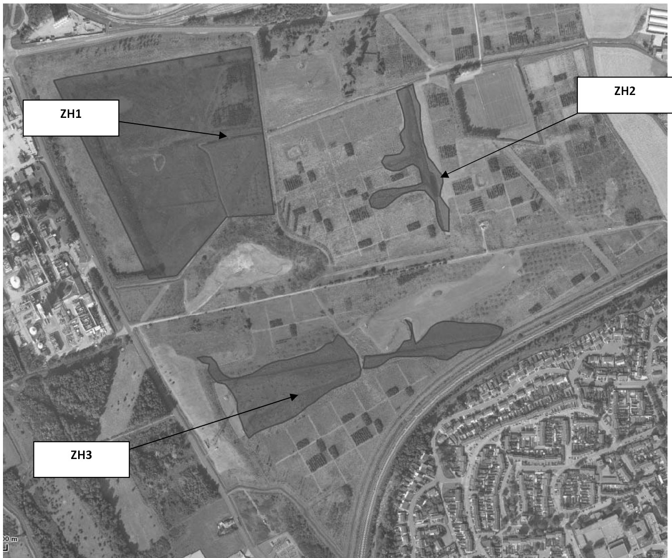
Zones non accessibles (réf aux articles 3.5 et 3.9)