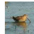
Bécassine des marais