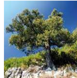
Genévrier de Phoenicie

* Ripisylve formations végétales qui se développent sur les bords des cours d'eau ou des plans d'eau situés dans la zone frontalière entre l'eau et la terre Calcaro-marneuses contient du calcaire et de la marne (roche sédimentaire composée de calcaire et d'argile)