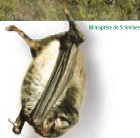
Minioptère de Schreibers

La grotte des Sadoux accueille de nombreuses chauves-souris. C'est notamment un site important de reproduction du Minioptère et un lieu d'hivernage pour le Grand rhinolophe. Sept espèces, dont la préservation est aujourd'hui préoccupante voire menacée, ont été répertoriées sur le site : Minioptère de Schreibers, Grand rhinolophe, Petit rhinolophe, Rhinolophe euryale, Petit murin, Grand murin. On note aussi la présence d'insectes spécifiques des milieux cavernicoles.