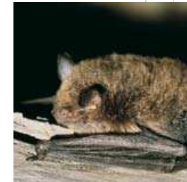
Murin de Daubenton