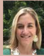
Fabienne SAVARY SMGMNL RN Marais d'Orx et RN Etang noir