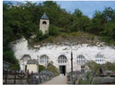
Haute-Isle : église troglodytique

A proximité immédiate du site de la réserve, monuments inscrits et classés (églises, châteaux, petit patrimoine rural) et villages pittoresques sont nombreux.