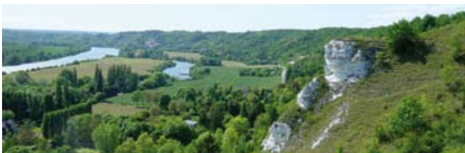
Vallée de la Seine

Les falaises de craies à silex, surtout connues en Normandie, sont excep-