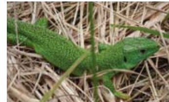
Lézard vert, espèce d'affinité méditerranéenne

Le site accueille une soixantaine d'espèces d'oiseaux, dont la Pie-Grièche écorcheur et la Bondrée apivore.