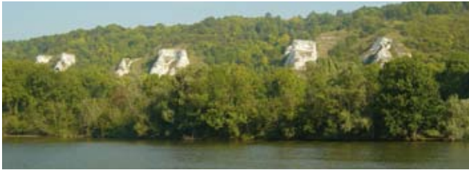
Berges de Seine

La réserve s'étend sur 5 communes appartenant aux départements du Val-d'Oise : Vétheuil, Haute-Isle et La Roche-Guyon ; et des Yvelines : Gommecourt et Bennecourt.