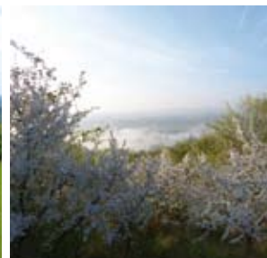
Prunelliers en fleur

Les habitats calcaires, principalement les pelouses, accueillent une faune et une flore spécifiques adaptées. Les conditions d'exposition au sud permettent même la présence d'espèces d'affinité méditerranéenne.