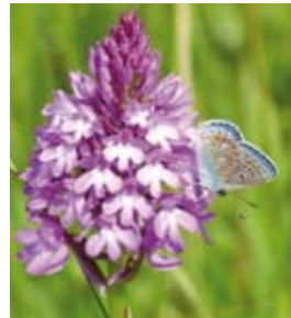
Azuré commun sur un Orchis pyramidal