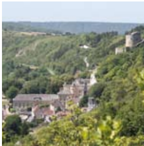
Vue de la Roche-Guyon

Ce site est reconnu pour sa flore exceptionnelle depuis le XVIII ème siècle. Autrefois occupés par des petites cultures, des vergers, vignes et pâturages, ces coteaux ont été peu à peu abandonnés. Depuis, les broussailles et boisements s'installent. Afin de le préserver, le site fut classé en site Natura 2000 en 2001, puis en réserve naturelle en 2009.