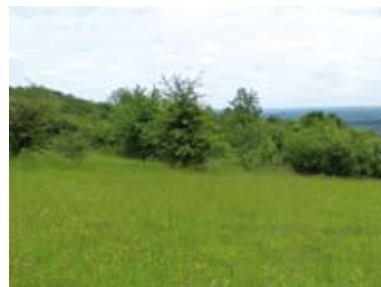
Pelouse mésophile et fruticée