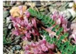
Astragale de Montpellier