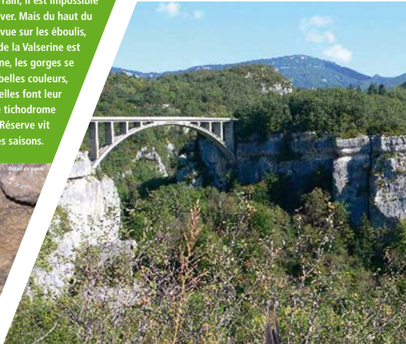
Détail de paroi

Située au cœur des gorges de la Valserine, la Réserve Naturelle Régionale du Pont-des-Pierres est un site majeur pour les chauves-souris. Trouvant refuge dans le milieu souterrain, il est impossible de les observer. Mais du haut du Pont-des-Pierres, la vue sur les éboulis, falaises et berges de la Valserine est imprenable. En automne, les gorges se parent de leurs plus belles couleurs, en été les hirondelles font leur apparition, en hiver le tichodrome prend place... La Réserve vit au rythme des saisons.