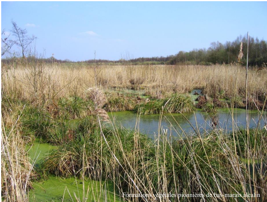
Formations végétales pionnières de bas-marais alcalin

Le site de Vred constitue l'une des trois dernières tourbières alcalines (pH neutre) régionales encore actives. C'est une zone humide continentale d'une superficie de 41 hectares qui s'inscrit dans le système alluvial de la basse Scarpe (près de 40 000 ha) et où la tourbe continue de s'y constituer. La variété des milieux (bois, étangs, roselières...) accueille une diversité de vie animale et végétale étonnante. On y recense par exemple la Grande douve (protégée au niveau national), une espèce de plante carnivore (l'Utriculaire commune), une espèce de mousse très rare pour laquelle le site constitue la quatrième station nationale ( Sphagnum riparium ) et d'autres espèces plus occasionnelles comme la Leucorrhine à gros thorax.