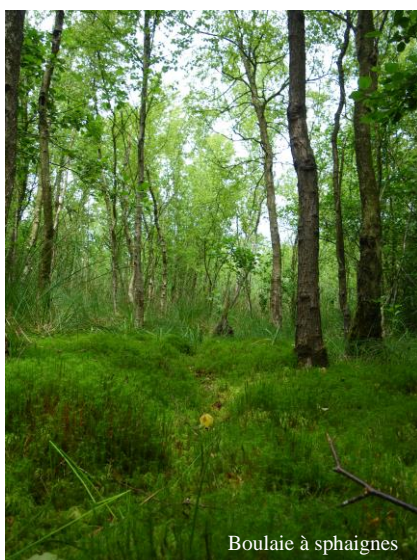
Boulaie à sphaignes

Le Parc Naturel Régional Scarpe Escaut met en œuvre et coordonne l'ensemble des activités sur ce site protégé. Il assure la gestion-conservation du site : suivi des niveaux d'eau, gestion de prairies par fauche et pâturage, travaux de restauration des roselières, inventaires et suivis d'espèces patrimoniales etc.