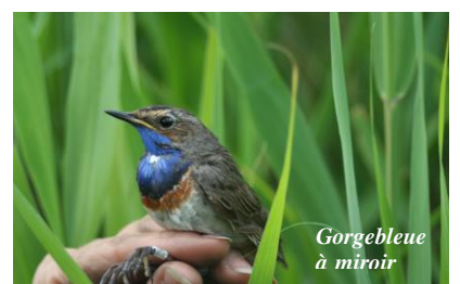
Gorgebleue à miroir

Le Parc Naturel Régional Scarpe Escaut met en œuvre et coordonne l'ensemble des activités sur ce site protégé. Il assure la gestion-conservation du site : suivi des niveaux d'eau, gestion de prairies par fauche et pâturage, travaux de restauration des roselières, inventaires et suivis d'espèces patrimoniales etc.