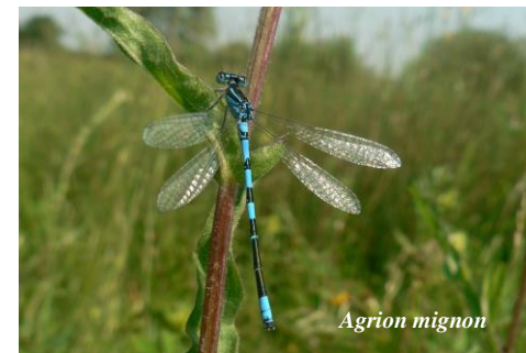
Réserve naturelle de la Tourbière de Vred