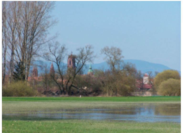
Le Ried inondé aux portes de Sélestat