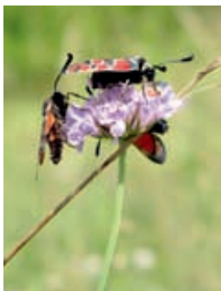
Zygènes sur une Knautie

Le Bastberg, promontoire calcaire chaud et sec de 326 m d'altitude, constitue un modèle unique de colline aride dans un environnement plus frais: il est démarqué des autres collines calcaires du piémont vosgien, dont il constitue le bastion le plus nordique.