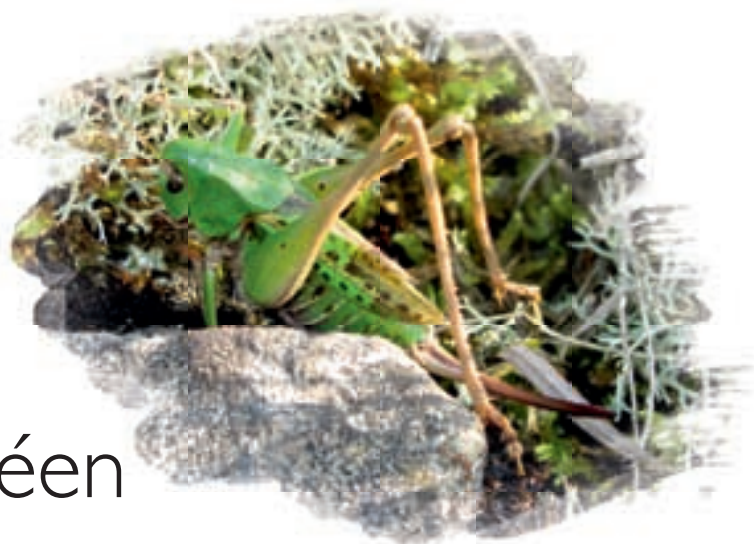
Criquet - Dectique verrucivore