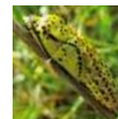
Chrysalide de Flambé